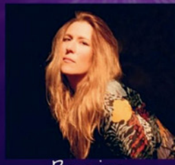
Beyries FOLK POP