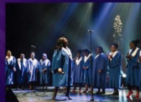
Gospel SPECTACLE DE NOËL